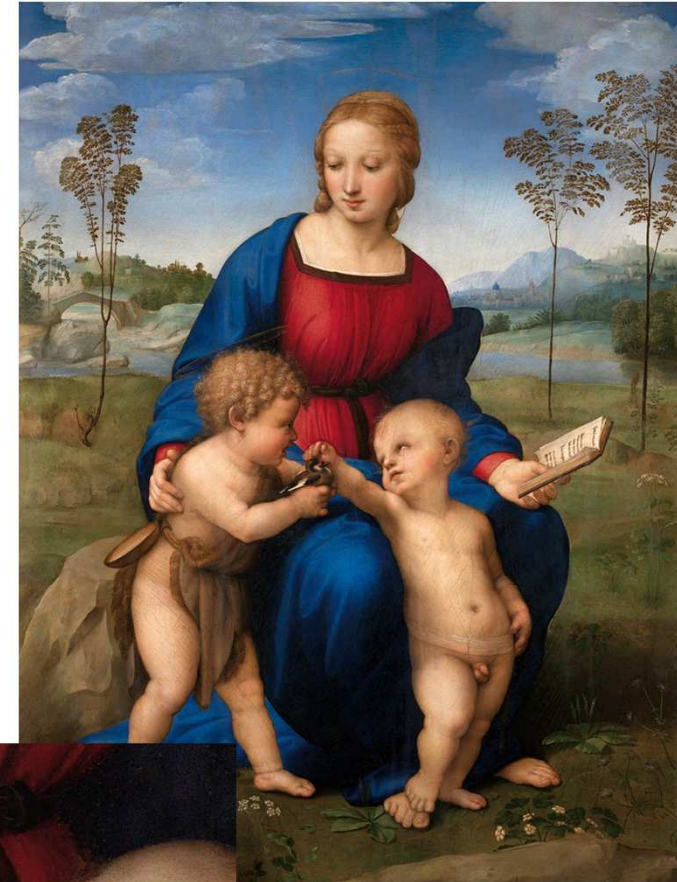
Raffaello, La Madonna del Cardellino