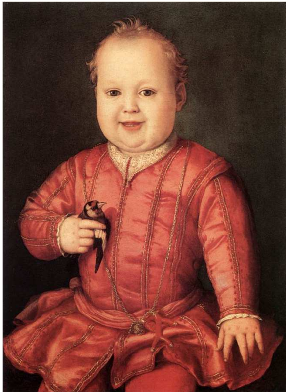
Angelo Bronzino, Ritratto di Giovanni De' Medici bambino

Nella poesia, nella tradizione popolare ma soprattutto nella pittura questo simpatico uccellino è stato oggetto di interesse per molti autori e artisti.